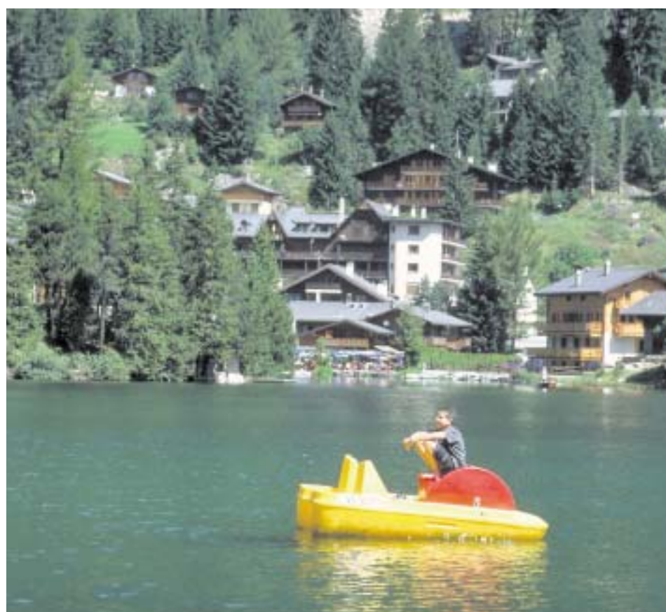
Farbtupfer auf dem See sind neben den blauen Barken der Forellenangler auch die Tretboote.

Preisgünstige Übernachtungen in der Schweiz bietet die Organisation „Bed and Breakfast“ mit Sitz in Basel: Privatunterkünfte mit unterschiedlichem Komfort vom Zimmer in der Altstadtgasse bis zur modernen Ferienwohnung. Die Preise mit Frühstück liegen mit 45 bis 60 SFR (27 bis 36 €) pro Person deutlich unter den Kosten im Hotel. Alle Häuser werden regelmäßig kontrolliert und erhalten Sterne entsprechend ihrer Lage und ihrem Service. Es gibt Einzelzimmer und Mehrbettzimmer, aber meist keine Kochgelegenheit. Das Bad muss evtl. mit einem anderen Gast geteilt werden. Informationen gibt's unter www.bnb.ch . Ein Katalog erscheint jedes Jahr im November in einer neuen Auflage und kann für 20 Euro incl. Versandgebühren bestellt werden: Eva Timmes, Hans Böckler-Straße 1, 45665 Recklinghausen, ☎ 02361/37 30 91, e.timmes@gmx.de .