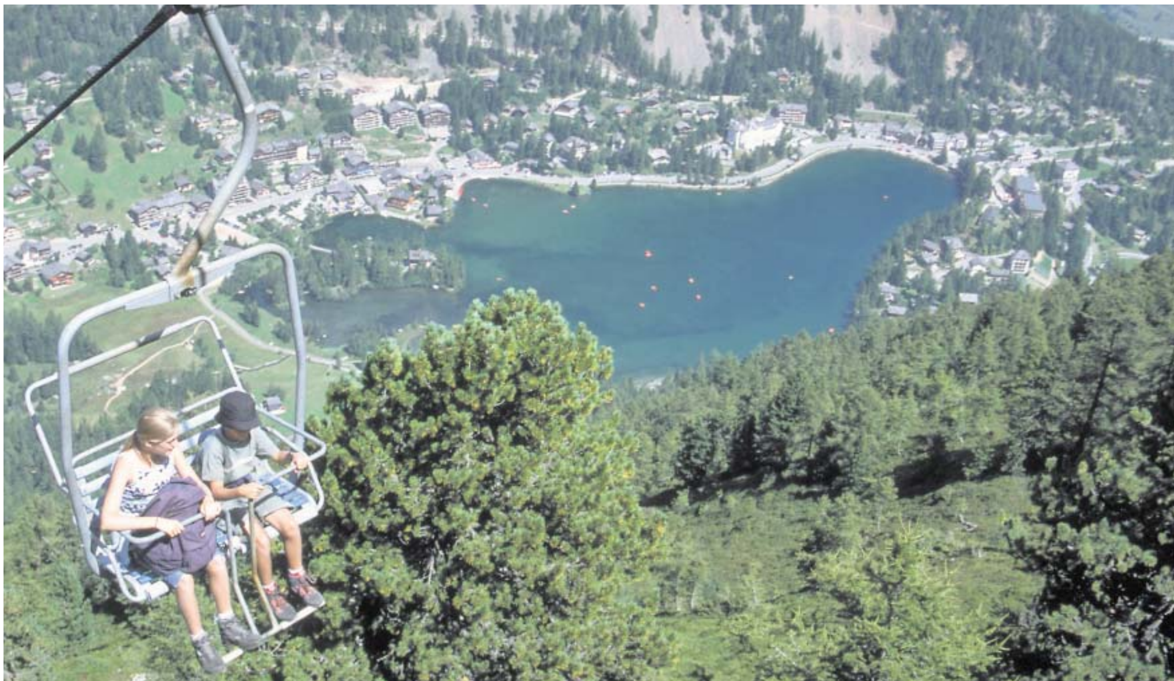
Aus dieser Perspektive werden die meisten Fotos für Postkarten von Champex Lac aufgenommen: aus dem Sessellift heraus.