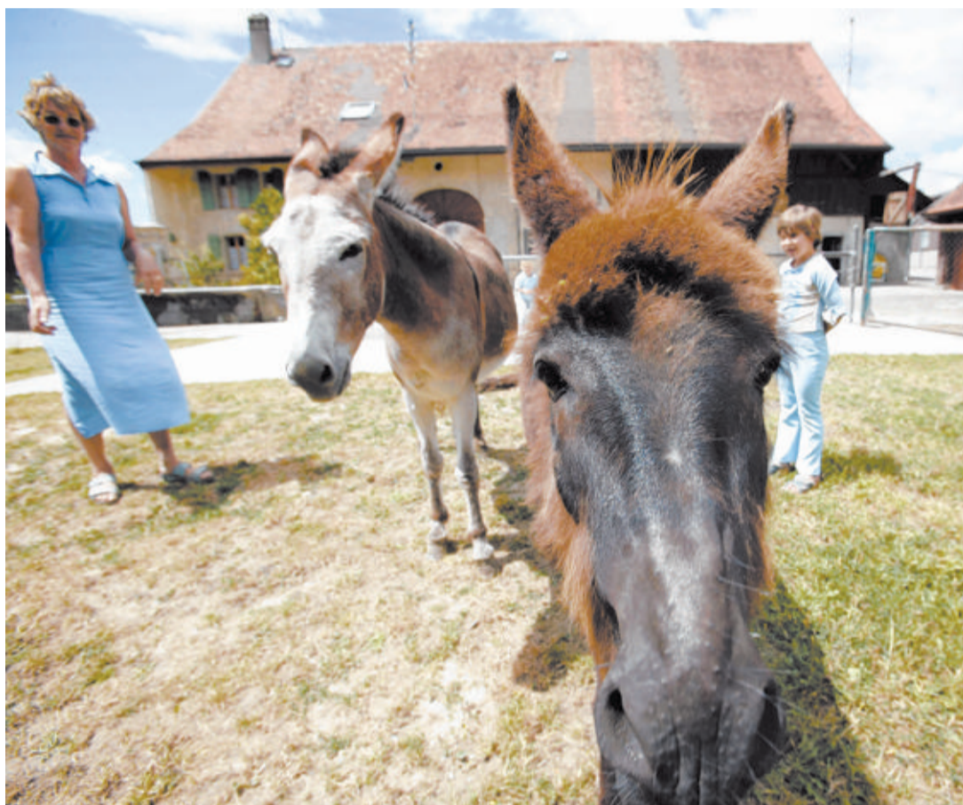
NATURE Les Bed & Breakfast sont un des rares secteurs qui connaissent un «développement considérable» dans tout le canton, selon les analystes de la BCV.

«Y en a point comme nous!» La célèbre formule de Gilles, natif de Montreux, sonne singulièrement creuse et sans portée à l'ère du tourisme globalisé. Publiée hier, l'étude de la Banque Cantonale Vaudoise (BCV) consacrée à la branche dresse un bilan implacable. A l'échelle planétaire, l'attractivité de la Suisse ne cesse de dégringoler. Et si le secteur a repris des couleurs depuis 2002, le réveil en terres vaudoises se fait au ralenti. Pour preuve: le nombre de nuitées dans l'hôtellerie, en progression de 4,2% fin septembre dans le canton alors que la