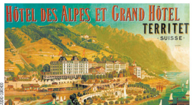
MYTHIQUE A son apogée, la région Montreux recevait les grands de ce monde. Comme la très célèbre Sissi, impératrice d'Autriche.

aborde la deuxième moitié du 20e siècle affaiblie, handicapée par le franc suisse et les coûts élevés de construction. Elle peine à moderniser ses infrastructures. Exemple: jusqu'en 1970, seules 34% des chambres d'hôtels disposaient d'une salle de bain privée. E. N.